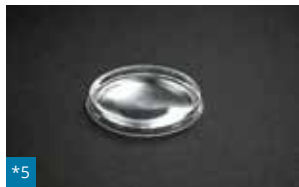
*5 006 - ø 68 mm