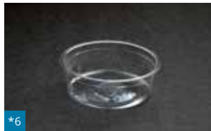
*6 073 - 65 ml/ø 76 mm