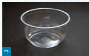
*9 030 - 250 ml/ø 100 mm