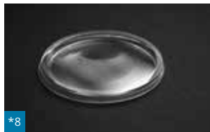
*8 040 - ø 95 mm