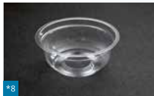
*8 091 - 100 ml/ø 95 mm