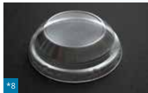
*8 061 - ø 95 mm