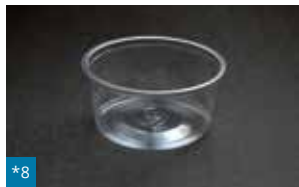
*8 057 - 200 ml/ø 95 mm