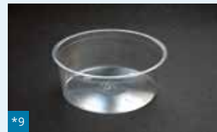
*9 058 - 220 ml/ø 100 mm