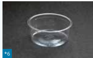
*6 070 - 80 ml/ø 76 mm