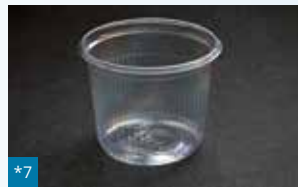
*7 004 - 210 ml/ø 84 mm