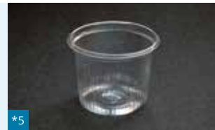
*5 001 - 100 ml/ø 68 mm