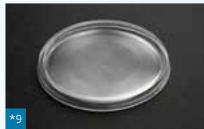
*9 031 - ø 100 mm