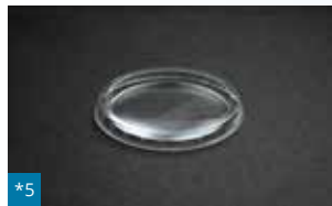
*5 052 - ø 75 mm