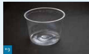
*9 044 - 330 ml/ø 100 mm