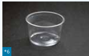
*6 072 - 130 ml/ø 76 mm