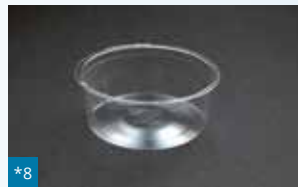
*8 063 - 150 ml/ø 95 mm