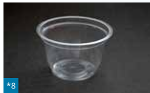
*8 093 - 200 ml/ø 95 mm