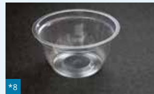
*8 092 - 150 ml/ø 95 mm