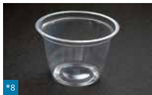
*8 094 - 240 ml/ø 95 mm