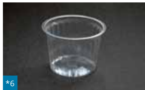
*6 054 - 150 ml/ø 76 mm