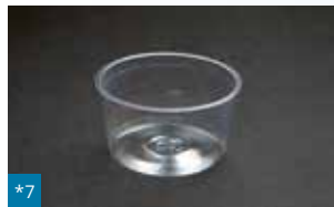
*7 003 - 150 ml/ø 84 mm