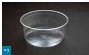
*9 064 - 240 ml/ø 100 mm