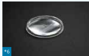
*6 008 - ø 76 mm