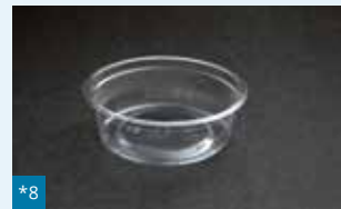
*8 055 - 130 ml/ø 95 mm