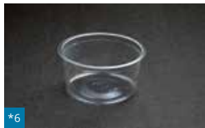
*6 071 - 100 ml/ø 76 mm