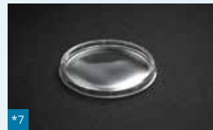
*7 007 - ø 84 mm